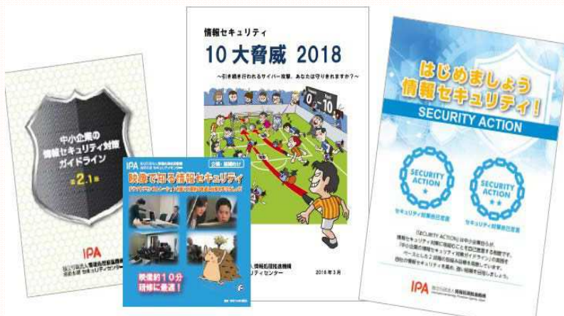
セミナー補助教材の一例

中小企業が情報セキュリティ対策を実施・支援する際に必要な、実践的な知識を学んでいただくために、全国各地で無料セミナーを開催します。